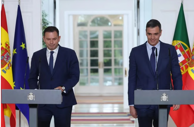
El presidente del Gobierno, Pedro Sánchez junto al primer ministro de la República de Portugal, Luís Montenegro.-Palacio de la Moncloa (Madrid) 04/05/2024.