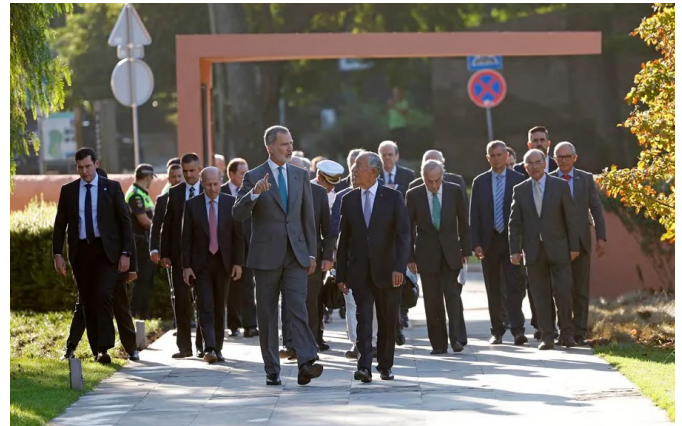
El rey Felipe VI junto al presidente de Portugal, Marcelo Rebelo de Sousa.- Cascais (Portugal) 30 de septiembre de 2023.